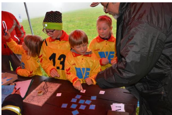
Obr. Stanoviště s olešnickými závodníky