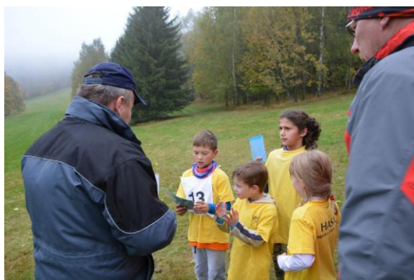
Obr. Stanoviště s olešnickými závodníky