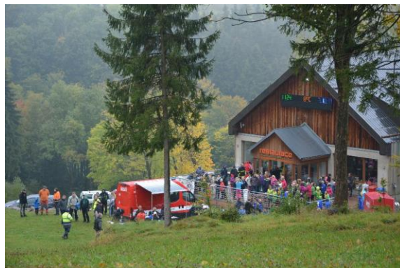
Obr. Zázemí SKI areálu Hartman

Závod byl naplánován s ročním předstihem, pořadatelé tedy na termín objednávali u sv. Petra i počasí. Není známo, kde nastal problém, snad