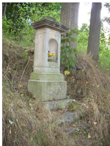
Obr. Starší fotografie křížku

Spasiteli, očisti od hříchu dny mého života a uhod' poslední hodinu pro mě, bud' jen milostivý, prosím Tě. (eb)