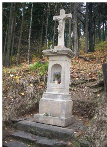
Obr. Aktuální fotografie křížku