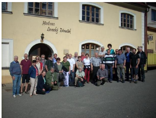
Účastníci setkání betlémářů