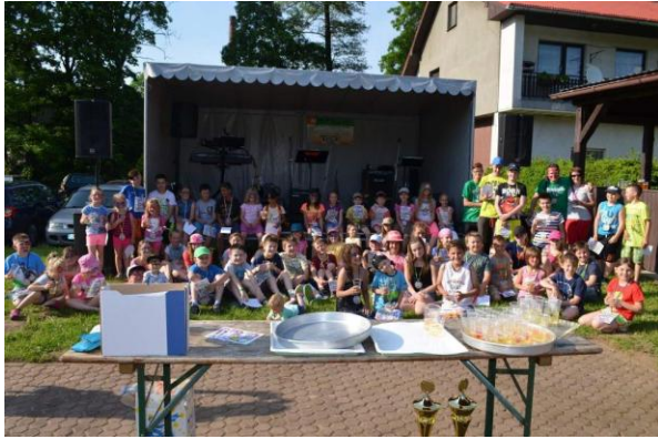
1. ročník Olešnického Hraníbrání