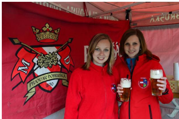
Olešnické hasičky se staraly o občerstvení

Výsledné náklady na realizaci tohoto projektu byly pro obecní kasu ve výši cca 5.828 Kč. Věříme tomu, že je to pro obec dobrá investice, která se určitě vrátí, i když jedním dechem lze citovat již dřívější konstatování jednoho člena zastupitelstva, který řekl: „Tato investice se nejlépe vrátí, pokud nebude nikdy na nic potřeba“. Na konci června mělo nové vozidlo za sebou již čtyři „ostré“ výjezdy, kdy bylo krajským operačním důstojníkem vyzváno k zásahům. (vk)