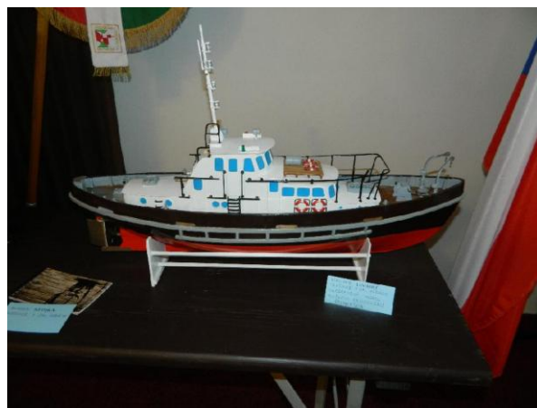
Lod' od p. Linharta