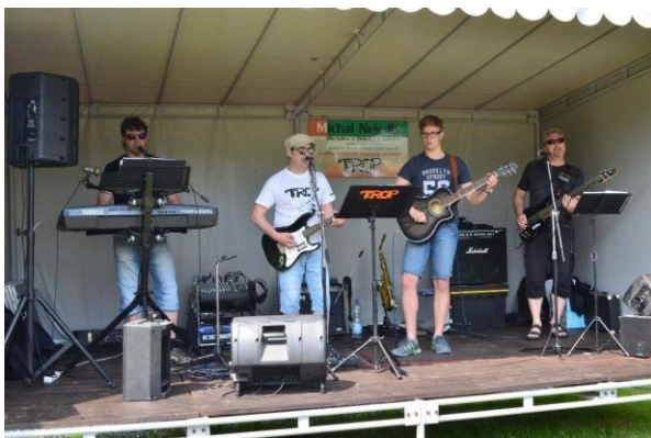
Hudební skupina TROP