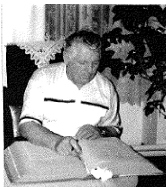
Zpracoval a napsal Zdeněk Bachura Kronikář obce Olešnice – srpen 2021

V dnešní době pandemie, kdy panuje zmatek, nejistota a bezperspektivnost v každodenním shonu života. Politici jsou hašteřiví, lež vesele vládne nad pravdou. Domnívám se, že moje kronikářská práce se s těmito věci neslučuje, ta je pohlazením na duši!