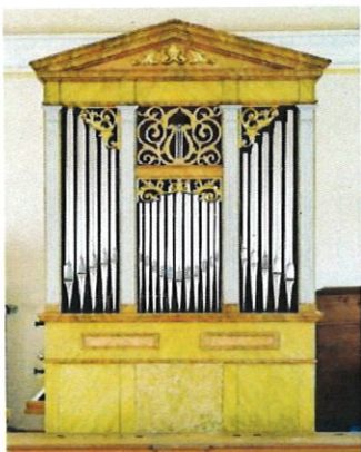
JIŘÍ TYMEL - VARHANY