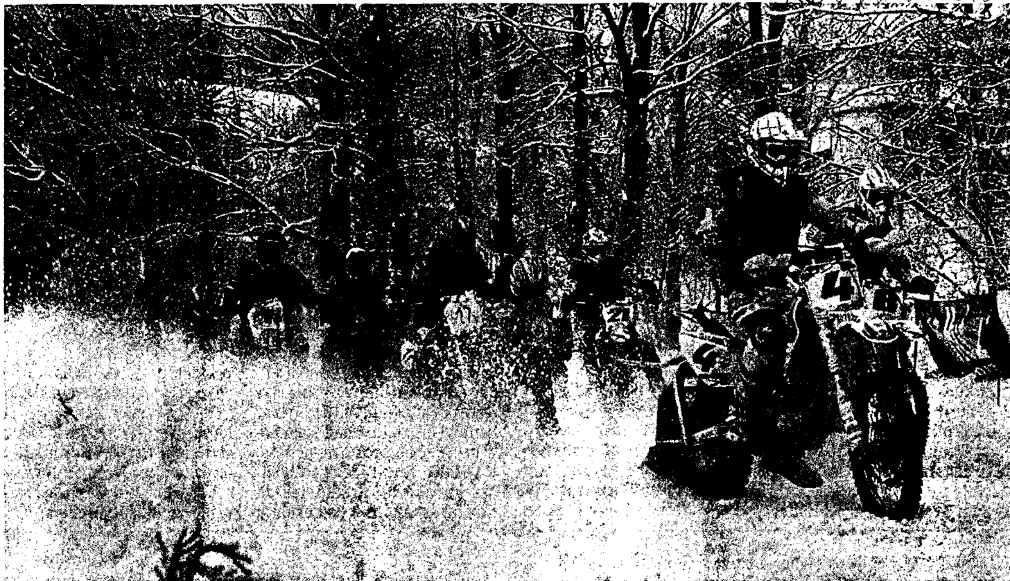
OSTRÝ START jedné z kvalifikačních jízd mistrovského závodu v motoskiřöingu v Olešnici v Orlických horách.